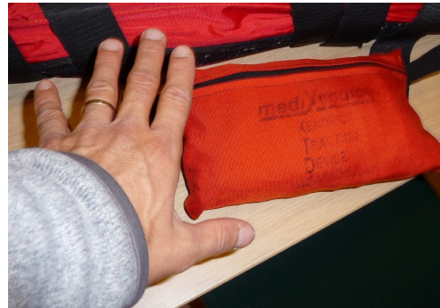
Kendricks Traction Device